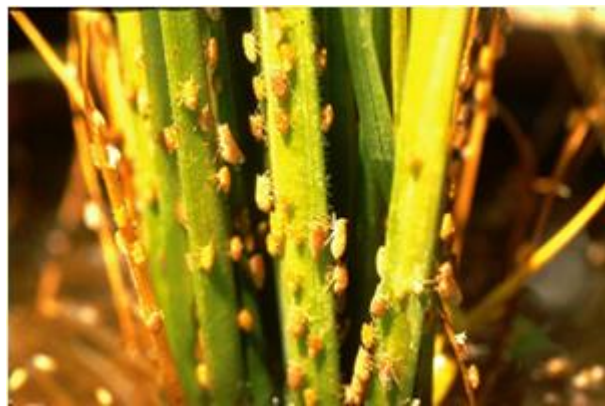
ลักษณะการระบาดรุนแรงในนา