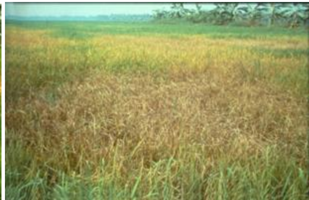
อาการไหม้ (hopperburn) ของต้นข้าว